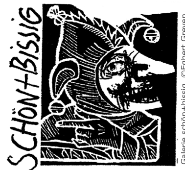
Galerie schön+bissig, ©Egbert Greven

Nach seinem Studium der Gebrauchsgrafik an der Werkkunstschule in Dortmund lebte er seit 1976 als freiberuflicher Grafiker, Illustrator und satirischer Zeichner in Oberbayern.