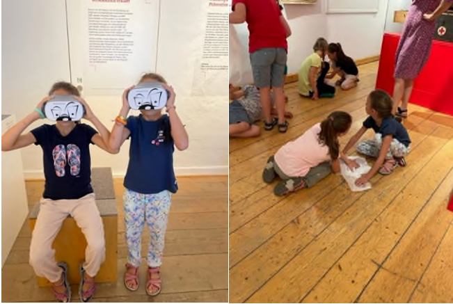
Bilder 2 und 3