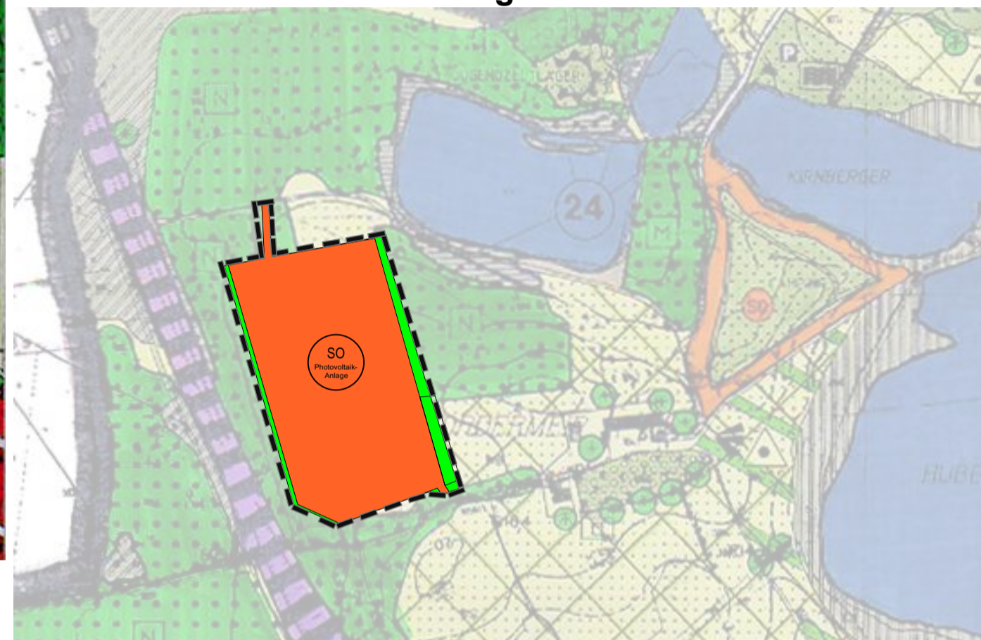
Flächennutzungsplan mit integriertem Landschaftsplan Stadt Penzberg; Ausschnitt Gut Hub M 1 : 5.000 Änderungsbereich

Zeichenerklärung wirksamer Flächennutzungsplan Für den Ausschnitt gilt die Zeichenerklärung des wirksamen Flächennutzungsplanes