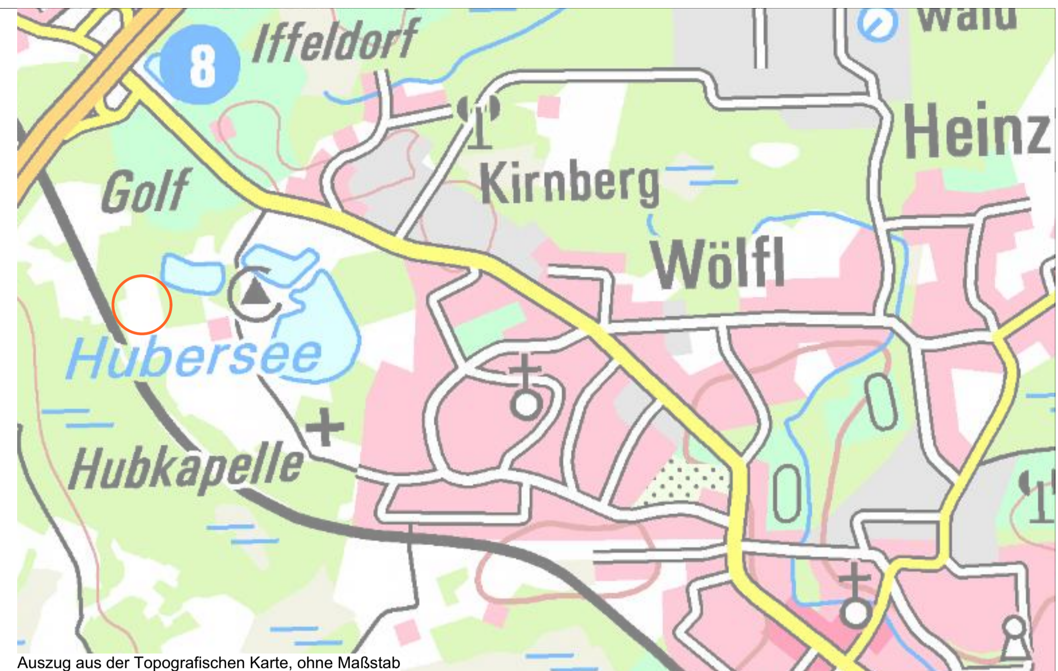
Auszug aus der Topografischen Karte, ohne Maßstab