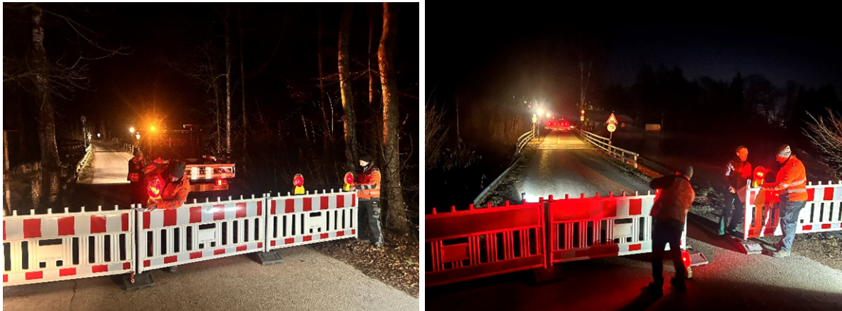
Mitarbeiter des städtischen Bauhofs haben spätabends noch die Vollsperrung des Dammes zwischen Kirnbergersee ( „Huberer Weiher“) und „Kleiner Weiher“ eingerichtet.