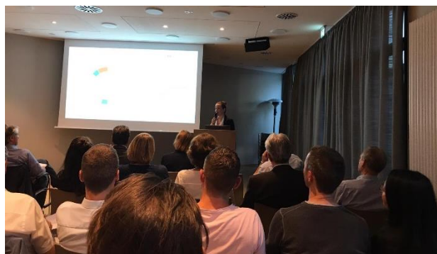
2. Penzberger Wirtschaftstreff am 16.07.2019 in der Stadthalle Penzberg